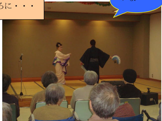
ハッピー交友会☆ かっこよかったですよ(^.^) でも…実は、男役をしていたのは女の人でした。