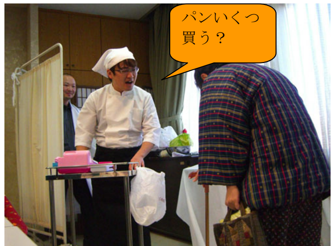
家族会★ 職員全員で歌、劇、スライドショーを行いました☆みんな衣装もバッチリでした。職員も誰か 分からなかった人も・・・(^.^)