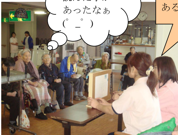
紙芝居の始まり始まり～☆ 皆さんもお子さんに聞かせたお話があるかな (^.^)