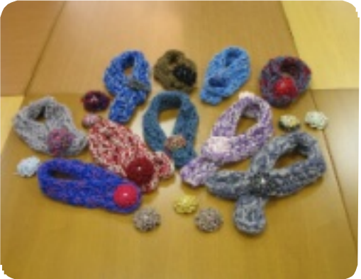
手編み教室ではマフラーを作成!